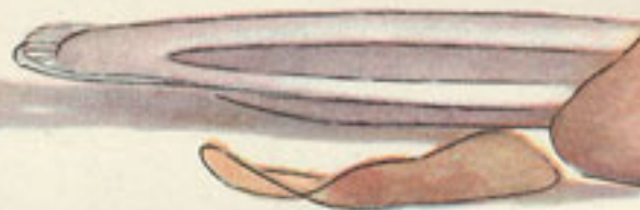
fuelle de gratinar