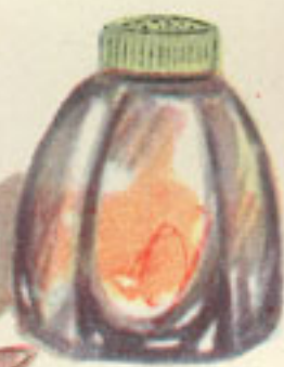
pimienta en polvo